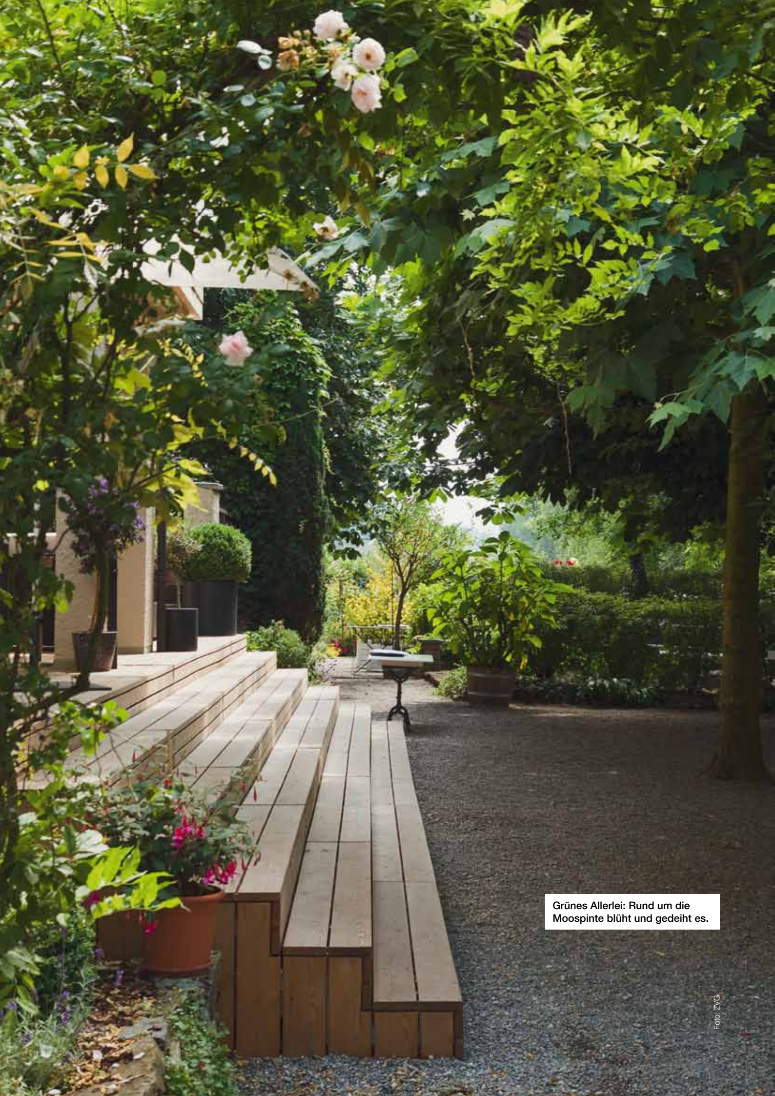
Grünes Allerlei: Rund um die Moospinte blüht und gedeiht es.