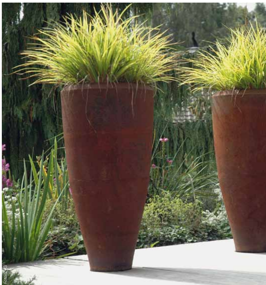
Schmal, aber oho: Hohe, schlanke Töpfe brauchen wenig Platz – und erzielen eine grosse Wirkung.

Für Gartenplaner Schöni ist das ein zentraler Punkt: Wenn es den Menschen, die über den Garten verfügen, nicht wohl sei – «dann bringt das gar nichts.» Es gebe eben verschiedene Restaurants und somit auch verschiedene Gärten. Ein Duftgarten etwa, einer mit Rosen, Salbei und Pfingstrosen, deren Düfte die Luft schwängern, mache sich nicht in jeder Umgebung gut. «Mitten in der Stadt wirkt das an den Haaren herbeigezogen», sagt Schöni. Wenn es aber zum