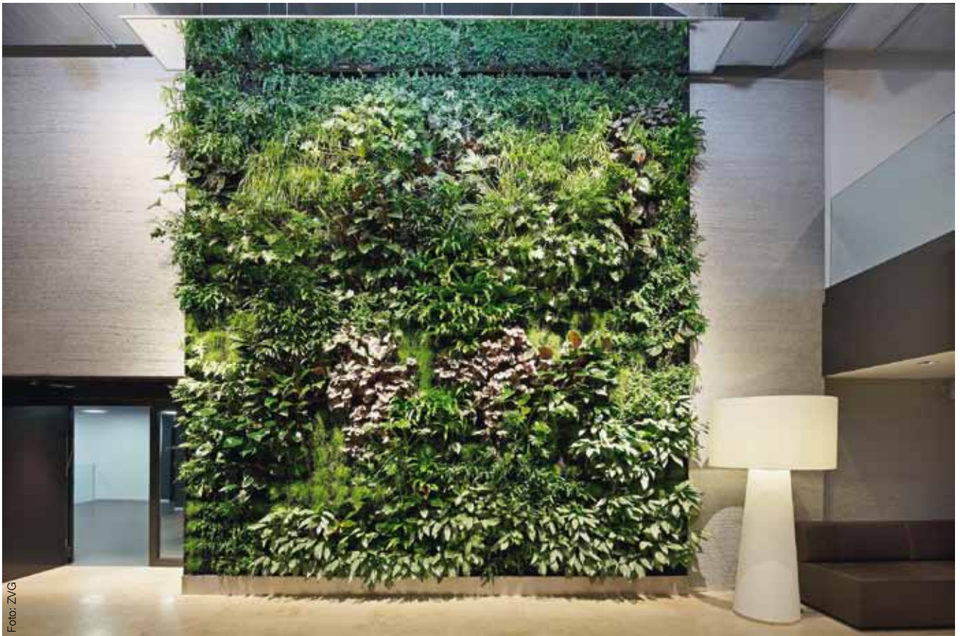
Senkrechtstarter: Mit der «lebenden Pflanzenwand» holt man sich den Garten ins Haus.

nige grosse Elemente als viel kleiner Krimskrams. «Einfach weil das besser wirkt.» Schöni kramt in seinen Unterlagen und zaubert ein kürzlich umgesetztes Beispiel hervor: Da stehen vier massige Töpfe, darin je eine Felsenbirne, die im Frühling blüht, einen formschönen Wuchs und eine herrliche Herbstfärbung aufweist. Pflanze und Topf erreichen eine Höhe von rund vier Metern. «Das spendet Schatten und vermittelt Geborgenheit», sagt er. Ohne bauliche Massnahme, sondern rein mit dekorativen Elementen. «Eine solche Lösung ist zackzack umgesetzt.» Klar ist, das räumt Schöni ein: Wer seinen Restaurantgarten mit so grossen Elementen gestaltet, muss Raum opfern. Er gibt aber zu bedenken: «Auch viele kleine Töpfe brauchen Platz.» In engeren Verhältnissen schlägt er darum vor, auf mannshohe, schlanke Gefässe zu setzen. Oder auf Ampeln, die in der Höhe hängen. «Wer in die Höhe geht oder vertikal begrünt, spart Platz.»